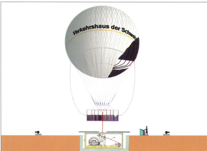
Abb. 3: Der Hiflyer im Verkehrshaus. Das Helium in der Hiflyer-Hülle ist unbrennbar. Es sorgt für einen Auftrieb von fünf Tonnen. Nach Abzug des Gewichts von Hülle, Gondel, Kabel und Passagieren bleibt ein Auftrieb von einer Tonne, der den Ballon steigen lässt. Von der Winde unter der Plattform wird der Hiflyer wieder zurückgeholt. Die kleinen Winden dienen zum Verankern des Ballons über Nacht und bei Wind von mehr als 40 km/h.