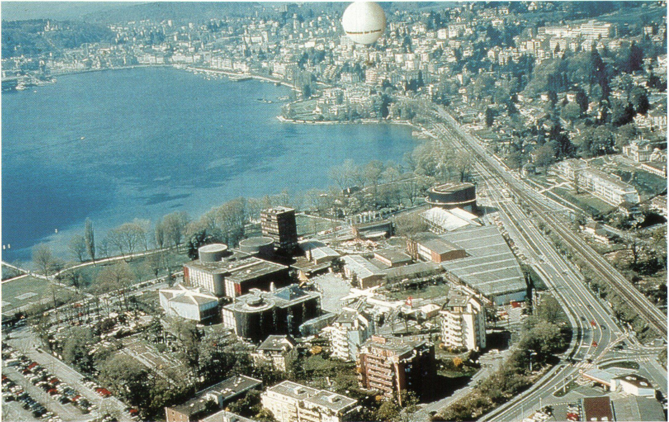
Abb. 4: Der Hiflyer über Luzern.

vielmehr, weil sich die Österreicher von diesem ersten militärischen Einsatz eines Ballons völlig demoralisieren liessen. Fesselballone waren aber nur beschränkt gefechtstauglich, denn die schwerfällige Vorrichtung, mit der – durch das Begiesen von Eisenspänen mit verdünnter Schwefelsäure – Wasserstoff gewonnen wurde, konnte im Kampfgeschehen nicht schnell genug verlagert werden.