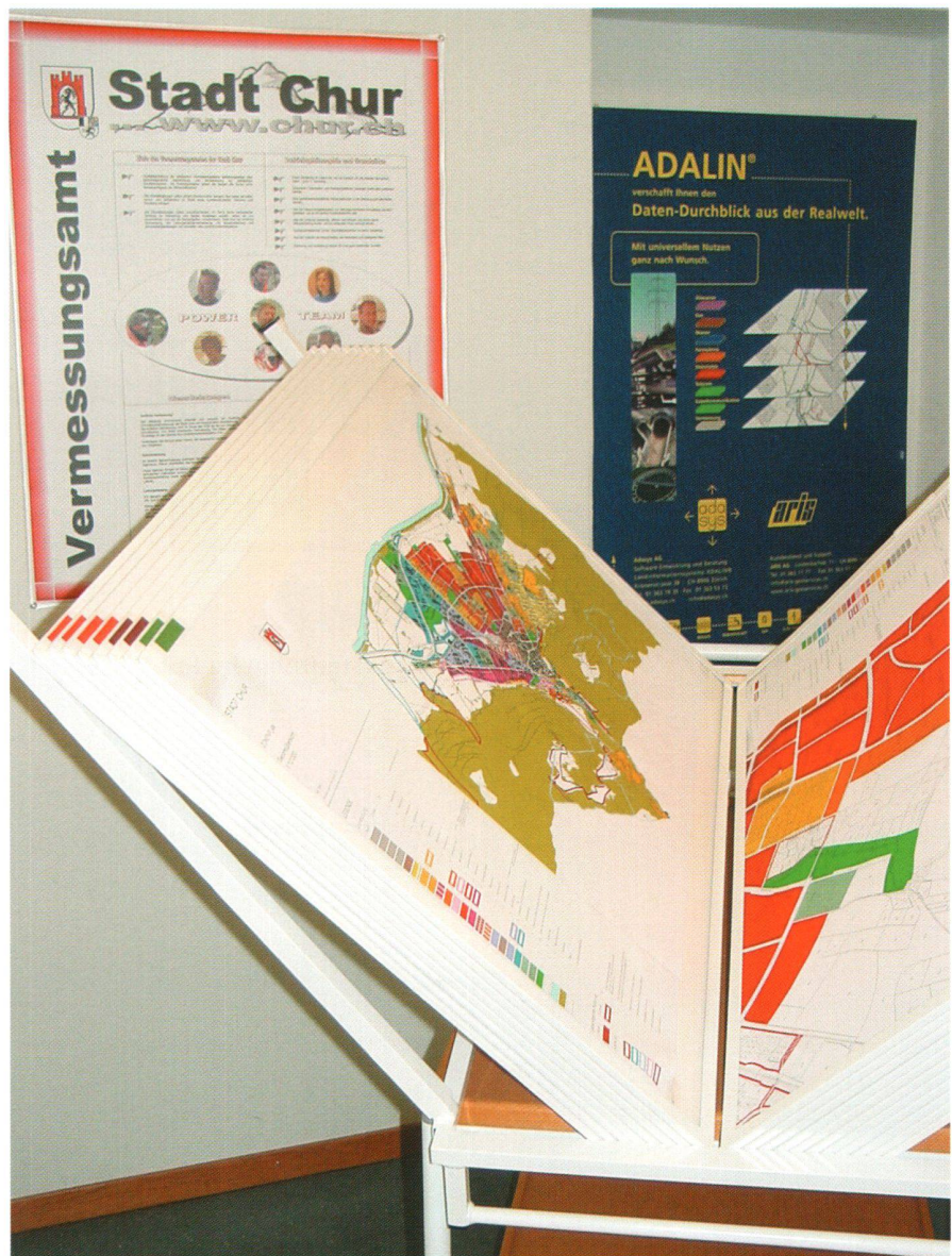
Abb. 3: Planprodukte.

Der Internet-Auftritt mit den geografischen Daten war für uns nicht nur ein wichtiger Meilenstein innerhalb des GIS-