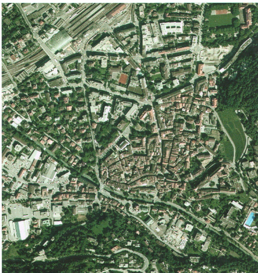
Abb. 1: Luftbild Chur.

Die noch intensivere Nutzung des Bodens, so z.B. für eine unmittelbare wirtschaftliche Nutzung, entspricht dem Sondernutzen. Dieser verlangt somit eine höhere Abgeltung. Beim sinngemässen Datenangebot könnten damit z.B. Einwohnerzahlen und deren Altersstruktur, verteilt im Hektarraster über das Siedlungsgebiet, vergleichbar sein. Neben den Aufwen-