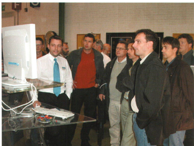
Die Katasterlösung verblüfft die zahlreichen Besucher.

die Dokumente auf Knopfdruck. Weitere Funktionen zur Überprüfung und Anzeige der Mutationszustände, Hierarchien etc. gehören ebenfalls zur Standardversion.