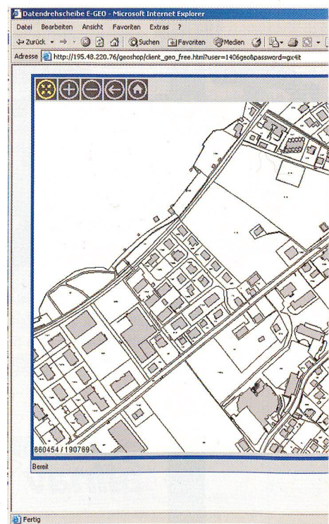
Abb. 1–3: www.sachseln-geo.ch: Landeskarten, amtliche Vermessung AV93 und Orthofoto als Grundangebot für Gemeinden.