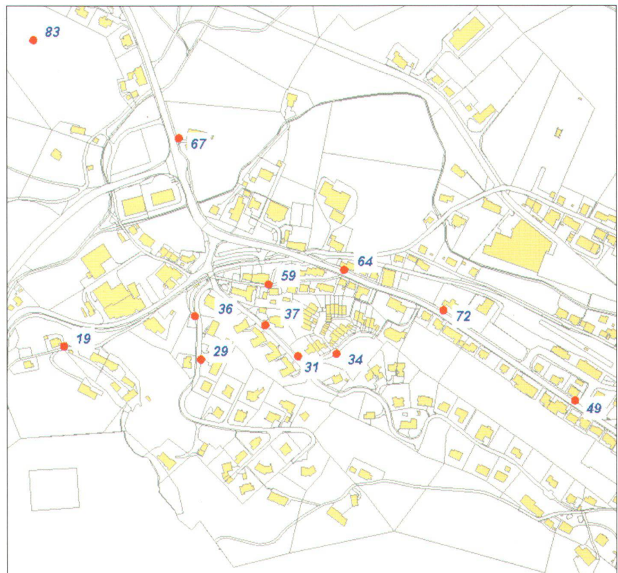
Abb. 1: LFP3 ohne Höhe mit Höhenzuverlässigkeit JA.

Export durchgeführt werden. GRIPSmedia verwendet ebenfalls die Text Pipes von GEOS Pro. Die Funktionen von ProCalc stehen auch für GRIPSmedia vollumfänglich zur Verfügung.