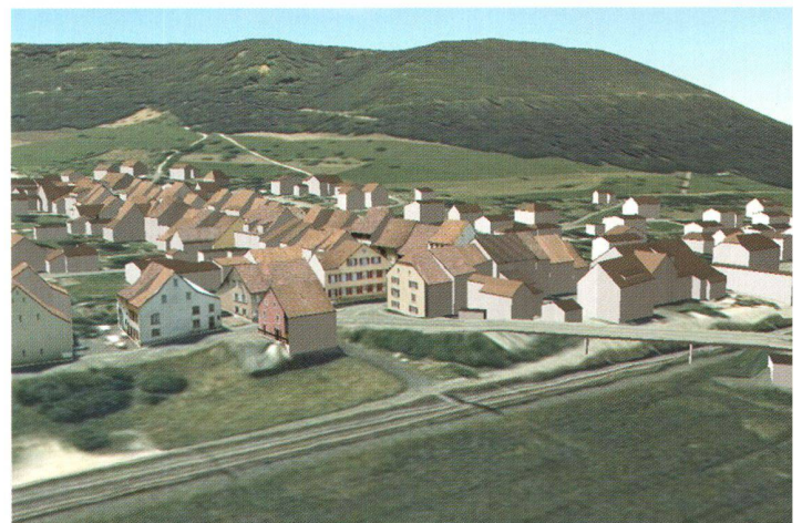
Abb. 2: 3D-Landschaftsmodell (Gemeinde Itingen BL) – generiert und verwaltet mit DILAS.