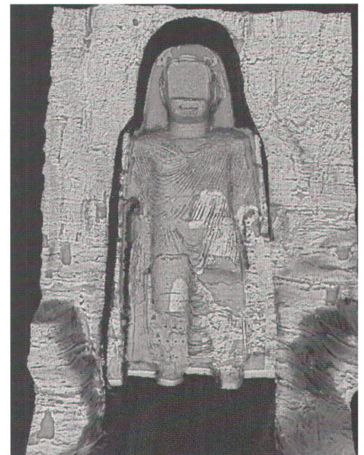
Abb. 3: Rekonstruktion des Grossen Buddhas von Bamiyan, Afghanistan.

nerierung und vollautomatischen Hausextraktion aus Mehrfach-Farbluftbildern. AMOBell: Konzentration auf Verfeinerung der Detektion und Rekonstruktion von Gebäudemodellen. Kooperation: Gruppe Bildwissenschaften am Institut für Kommunikationstechnik, ETH Zürich.