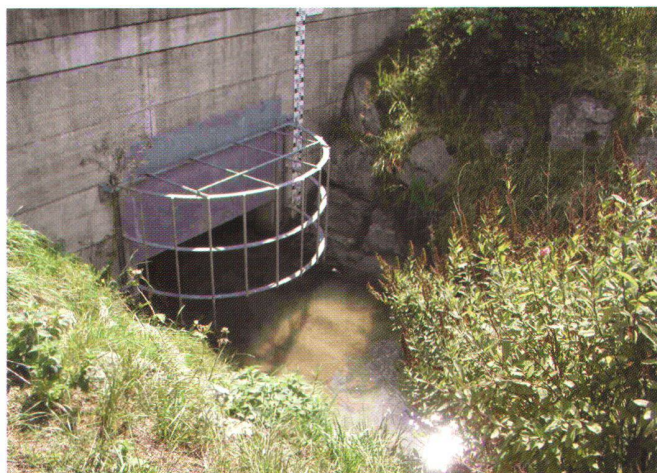
Abb. 2: Mit einem Polder-System wird das mögliche Hochwasser des «Chrouchtalbachs» zurückgehalten. Die Drosselung der Wassermenge erfolgt mittels Schiebern. Ein Grobrechen verhindert das Verstopfen der Schieberöffnung.