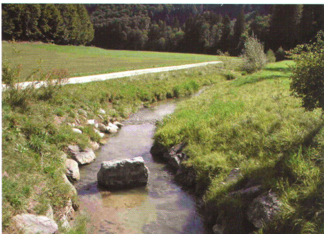
Abb. 1: Der «Chrouchtalbach» wurde beispielhaft renaturiert: Das Fließgewässer erhielt seinen Raumbedarf zurück (Fotos: Karin Bovigny-Ackermann).

Projekt für das ganze Gemeindegebiet zu erstellen, landwirtschaftliche Güter neu aufzuteilen und zusammenzulegen, alte Wege und Ställe zu sanieren oder neue zu erstellen. Im Rahmen der Gesamtmelioration wurde auch eine langjährige Idee der Neugestaltung des «Chrouchtalbachs» in die Tat umgesetzt. Seit Jahrzehnten suchten die Gemeinden Burgdorf, Oberburg, Krauchthal und Hasle nach einer geeigneten Lösung, um die durch den «Chrouchtal-», «Luter-» und «Biembach» verursachten Hochwasserprobleme in den Griff zu bekommen. Man wollte sowohl die Siedlungen als auch die landwirtschaftlichen Flächen schützen. Gemäss Peider Mohr von der Abteilung Strukturverbesserungen des Kantons Bern war es nicht immer einfach, die verschiedenen Interessen unter einen Hut zu bringen.