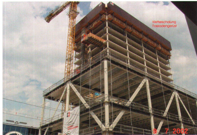
Abb. 3: Der Messeturm im Juli 2002.

Die Lösung beruhte schliesslich auf einer Lotung, die für jedes Stockwerk von denselben Ausgangspunkten im Erdgeschoss bzw. im zweiten Untergeschoss aus erfolgen sollte. Mit diesem Verfahren konnten sich somit keine Fehler fortpflanzen und der Schwingungseinfluss konnte in kurzer Zeit ermittelt und berücksichtigt werden. Der Entscheid fiel zugunsten von Lotungslasern aus, denn mit diesen war auch bei Dunkelheit und unter schlechten Lichtverhältnissen (Lotung der Kletterschalung Betonkern) eine Lotung ohne grösseren Aufwand und somit in kürzerer Zeit möglich. Den Instrumentenfehler der Laser von \pm 5 \text{ mm}/100 \text{ m} Lotungshöhe (Angabe des Herstellers) wurde durch eine zweilagige Lotung weitgehend eliminiert. Die Lotung des Hochhauses erfolgte über acht Punkte. Vier Punkte zur «Aussenlotung» (Lotung für Stahlbau) vom EG aus und vier zur «Innenlotung» (Lotung des Betonkerns) vom zweiten UG