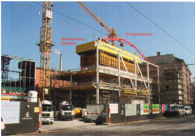
Abb. 2: Der Messeturm im März 2002.