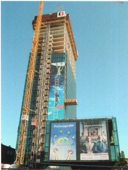
Abb. 4: Der Messeturm im Oktober 2002.