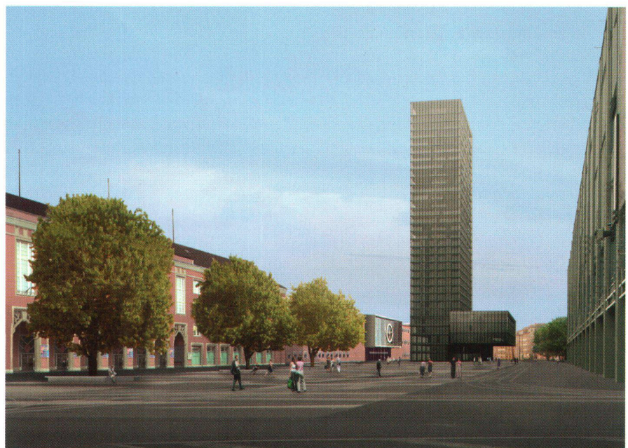
Abb. 1: Modell des Messeturms.

Für das Hinaufziehen der Stockwerke wurde die sonst übliche Absteckungsmethode mit Freien Stationierungen auf dem Arbeitsstockwerk mit Orientierung an aussengelegenen Fixpunkten wegen des Schwingungseinflusses und des für diese Arbeiten äusserst knappen Zeitfensters verworfen. Als weiteres entscheidendes Erschwernis für diese Methode kam hinzu, dass auf dem Arbeitsstockwerk das Fassadengerüst die Sicht nach aussen verunmöglichte.