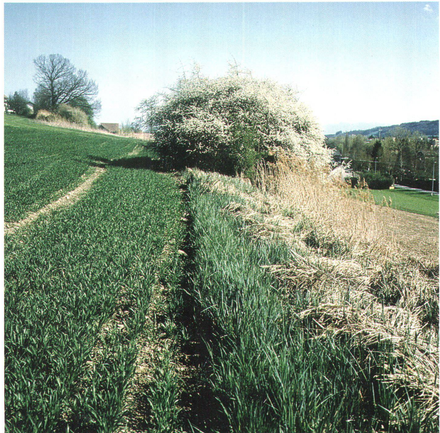
Abb. 2: Die vielfältige Landschaft ist auch ein Produkt der Landwirtschaft.

gleichs werden mit verschiedenen Programmen gefördert; an die Beitragsgewährung für den ökologischen Ausgleich nach Direktzahlungsverordnung sind bestimmte Bewirtschaftungsauflagen gekoppelt. Es gibt Elemente, die je nach Programm zwar anrechenbar, jedoch nicht beitragsberechtigter sind.