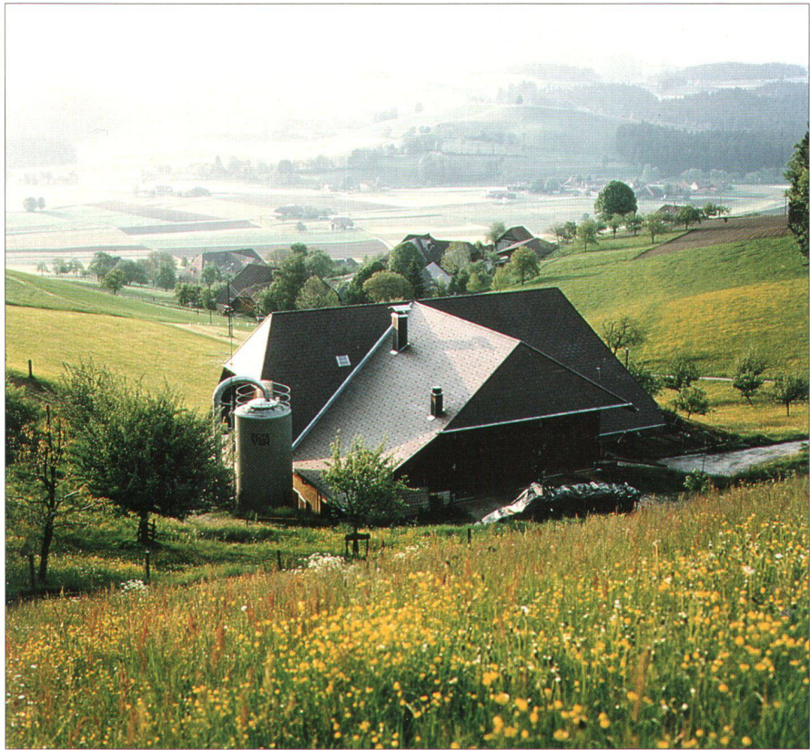
Abb. 1: Die Umsetzung der LEKs wird oft von der Landwirtschaft getragen.

Die Strukturverbesserungen und hier besonders die Güterzusammenlegungen sind seit langem ein effizientes Instrument der Agrarpolitik. Sie wurden zu jeder Epoche dem Zeitgeist und den Vorgaben der Politik entsprechend eingesetzt. Aus heutiger Sicht verbinden sie in idealer Weise die Verbesserung der Lebens- und Wirtschaftsverhältnisse in der Landwirtschaft und im ländlichen Raum mit den Anliegen der Ökologie und der Umsetzung raumplanerischer Interessen. Sie nehmen damit eine wichtige koordinative Funktion wahr.