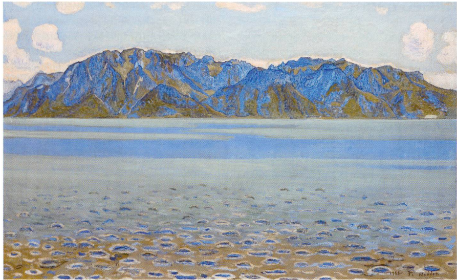
Ferdinand Hodler: Der Grammont, 1905.

Vom 5. März bis 6. Juni 2004 zeigt das Kunsthaus Zürich eine umfassende Ausstellung zum Landschaftswerk von Ferdinand Hodler (1853–1918). Zu sehen sind 72 seiner schönsten Landschaftsbilder – von den berühmten Darstellungen der Gipfel, Täler und Seen des Berner Oberlands und des Genfersees bis hin zu den subtilen Detailstudien von Bäumen, Bächen und Steinen. Das Landschaftswerk von Ferdinand Hodler gehört zu den schönsten des ausgehenden 19. und beginnenden 20. Jahrhunderts. Während zeitgenössische symbolistische Maler die Landschaft oft völlig frei ima-