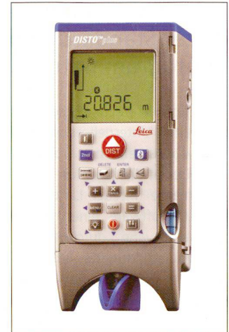
Leica DISTO™ plus.

Der Leica DISTO™ plus ist das weltweit einzige Gerät, das höchste Genauigkeit, edles Design und kabellose Datenübertragung mittels Bluetooth®-Technologie in einem bietet. Auch wenn Sie derzeit noch mit Papier und Bleistift arbeiten, dank integrierter Bluetooth®-Technologie können Sie jederzeit umsteigen und Ihre Messwerte elektronisch erfassen. Die Daten können vor Ort kabellos auf ein PDA (Pocket PC) oder direkt auf einen Laptop übertragen und spielend weiterverwendet werden. Die beiden kostenlosen Softwareprogramme erleichtern Ihnen Ihre Arbeit. Mit «PlusDraw» können am Pocket PC einfache Skizzen mit Messwerten erstellt werden. Die Skizze kann als Grafik (bmp-file) auf den PC überspielt werden, während Ihre Messdaten in einer eigenen Exceldatei gespeichert werden. «PlusXL» ermöglicht Ihnen, die Messwerte gleich direkt in einer Exceltabelle zu erfassen und am PC weiterzubearbeiten.