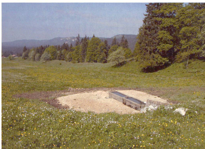
Fig. 4: Aménagement d'un captage.

Certains pourraient être remis en fonction de façon utile, et quand il n'y a ni source, ni puits (zones de calcaire dur), des couverts étaient construits pour récolter l'eau de pluie.