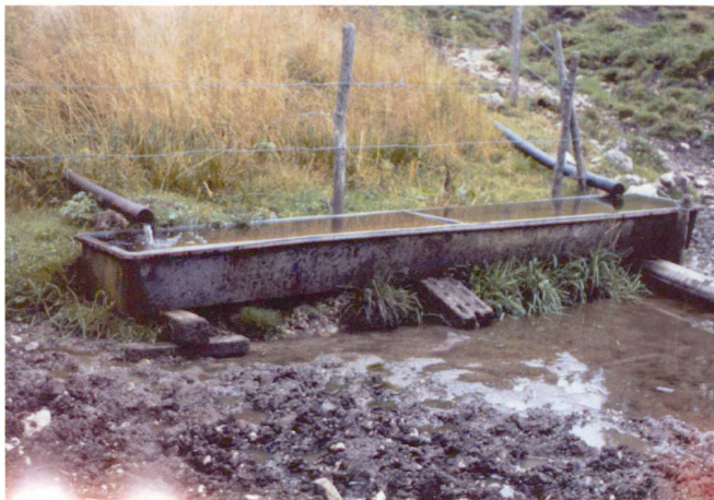
Fig. 2: Captage à restaurer.