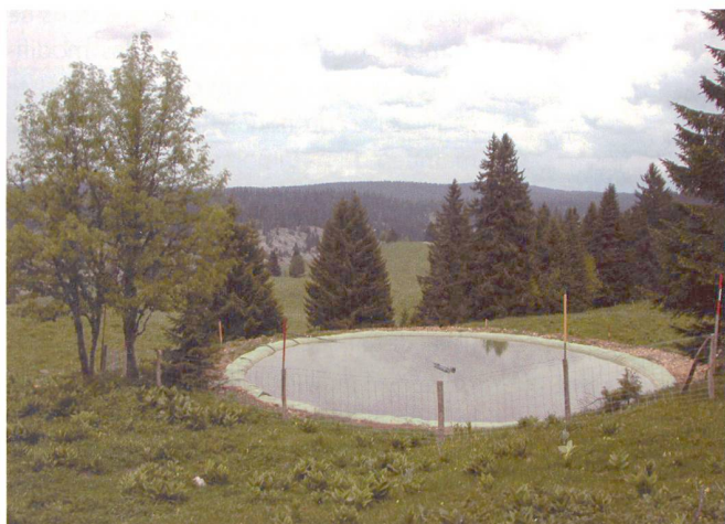
Fig. 3: Etang Trois Chalets.