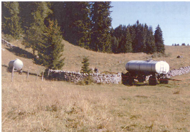
Fig. 1: Ancien puits et citerne mobile.