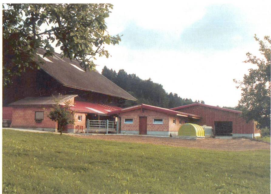
Abb. 2: Cormagens FR.

Bei den Installationen und Einrichtungen lassen sich am ehesten Kosten einsparen, indem das Wünschbare vom Notwendigen getrennt wird. Einsparungen am Gebäude werden leider oft von luxuriösen, teuren Installationen wieder wettgemacht. Diese Feststellung wiegt noch schwerer, weil beim Gebäude mit einer Nutzungsdauer von über 30 Jahren gerechnet werden kann (sofern mit flexiblen Elementen gebaut wurde), die Installatio-