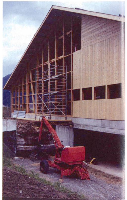
Abb. 4: Ernen VS.