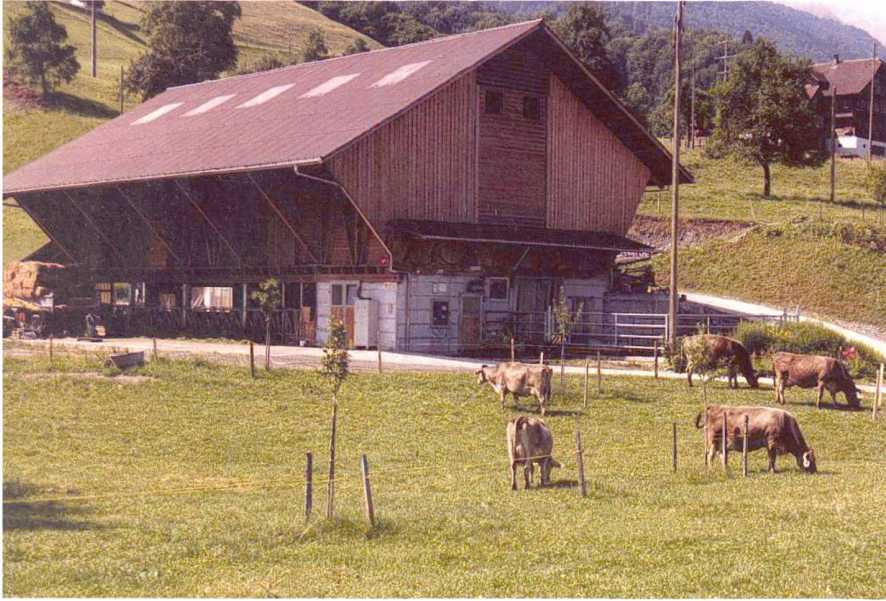
Abb. 3: Sachseln OW.

nen aber innerhalb von zehn Jahren abzuschreiben sind.