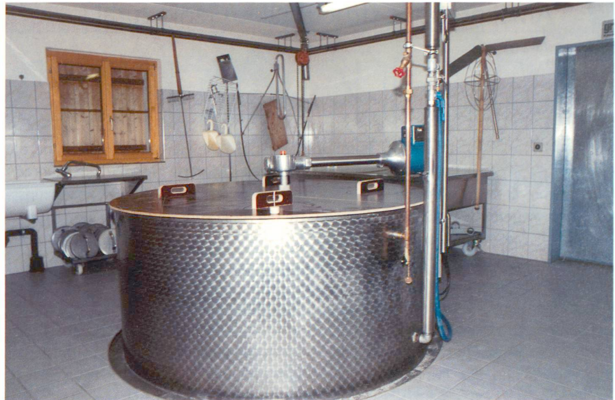
Abb. 2: Alp Pazzola: Inneneinrichtungen mit Käsekessi.

Dank der aufgelösten Bauweise und der weitgehenden Verwendung von Holz sind die Bauwerke gut in die als empfindlich geltende Landschaft eingepasst.