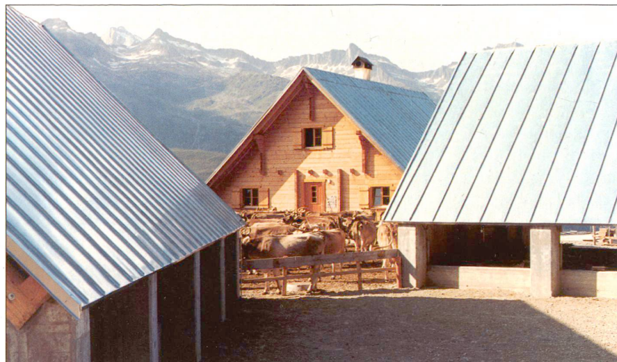
Abb. 1: Alp Pazzola: Stafelplatz mit Hütte und Unterständen.