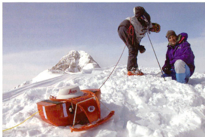
Das für die Messung der Schneedecke auf Mt. Everest und K2 entwickelte GPS-Georadargerät kann auch bei der Suche nach Verschütteten in Lawinenkegeln wertvolle Hinweise liefern. Hier beim Test in den Dolomiten.