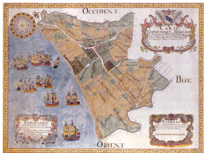
Fig. 2: Commissaire Tissot, Carte géométrique et régulière du territoire de Prévèrenge, dessin aquarellé, 1773, Archives cantonales Vaudoises.