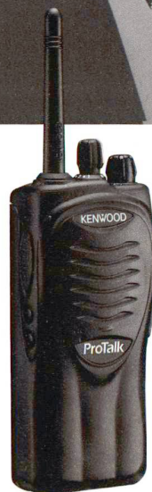
NEU ProTalk TK-3201

Funkgeräte von Kenwood sorgen seit 1946 für eine perfekte drahtlose Kommunikation. Heute werden unsere Produkte in 120 Ländern auf der ganzen Welt verkauft. Und sie haben sich einen Namen gemacht - wegen ihrer Qualität und Zuverlässigkeit auch unter härtesten Bedingungen. Daher gibt es nichts Besseres für Polizei, Notdienste, Bau- und Forstunternehmen, für den Einsatz Sport- oder Open-Air-Veranstaltungen und bei der Formel 1. Kenwood Funkgeräte sind immer die allererste Wahl.