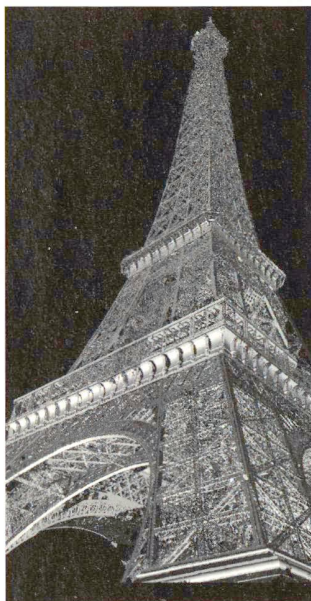
3-D-Punkt-Wolke mit GS200 vom Boden aus gemessen.

Die Stadtverwaltung tut einiges, um den Bürgerinnen und Bürgern das Leben zu erleichtern. Dazu gehört zum Beispiel das moderne Geographische Informationssystem TOPOBASE™ aus dem Hause c-plan, das Mitarbeitenden in ca. 20 Dienststellen und deren Kunden den schnellen Zugriff auf zahlreiche raumbezogene Informationen erlaubt.