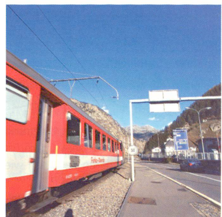
Abb. 4: Verkehrsinfrastruktur Andermatt.

Der Ausbau von Verkehrs- und Unterhaltungsinfrastrukturen steigert zwar die Attraktivität von Tourismusregionen, er bringt aber auch ökonomische, ökologische und soziale Belastungen mit sich. Das Projekt von Kay Axhausen (ETH Zürich) untersucht die Konsequenzen aus der zunehmenden Erschliessung der Landschaft für deren Nutzung. Die Ergebnisse, welche sich u.a. auf Verkehrsmodelle und re-