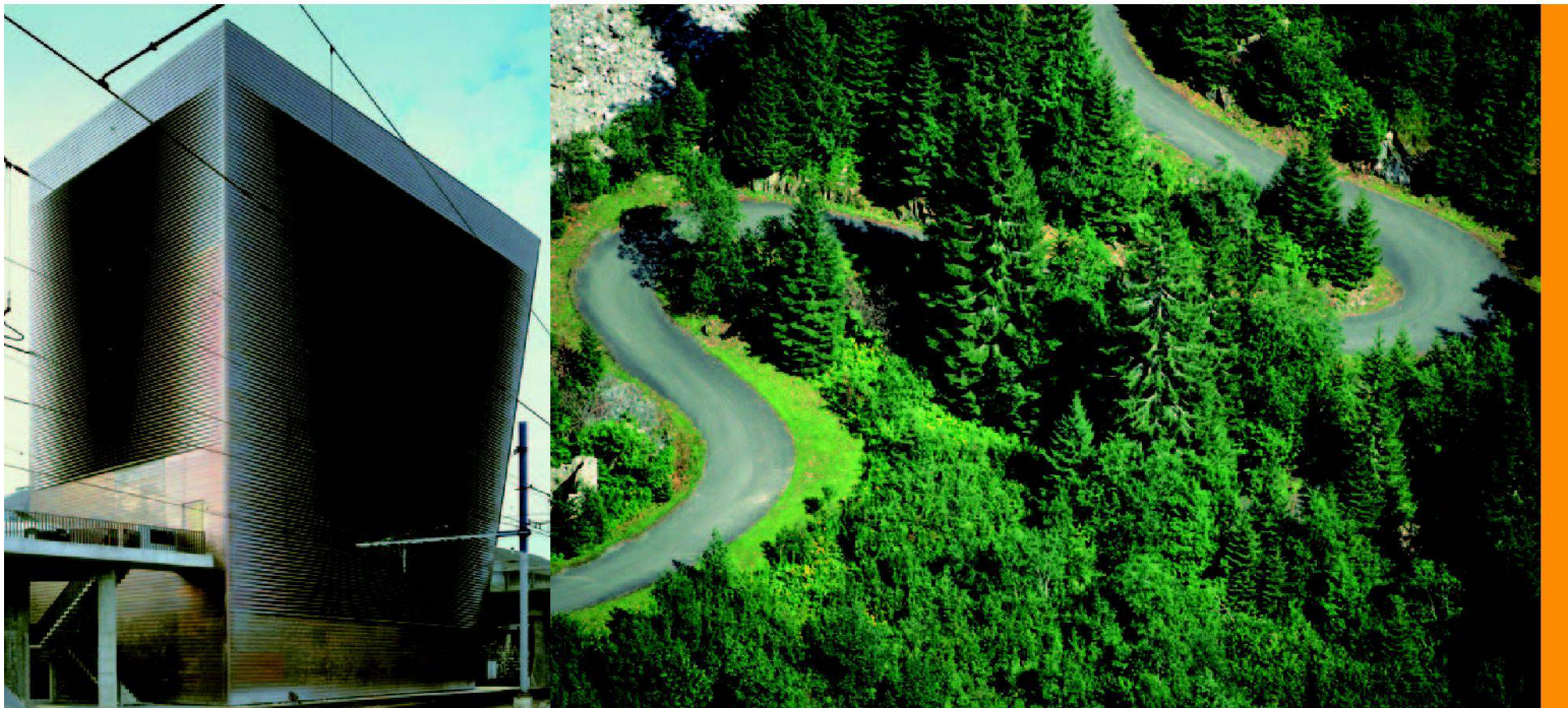
Zentralstellwerk SBB in Basel. Architekten: Herzog + de Meuron