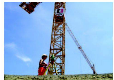
Bei Kranen: Immer Helm auf!