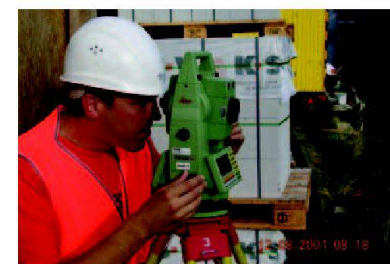
Kluge Köpfe schützen sich! Der VSVF ist dabei!