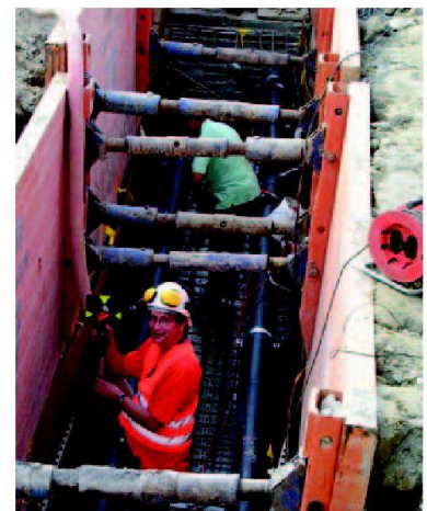
In Gräben: Immer Helm auf!