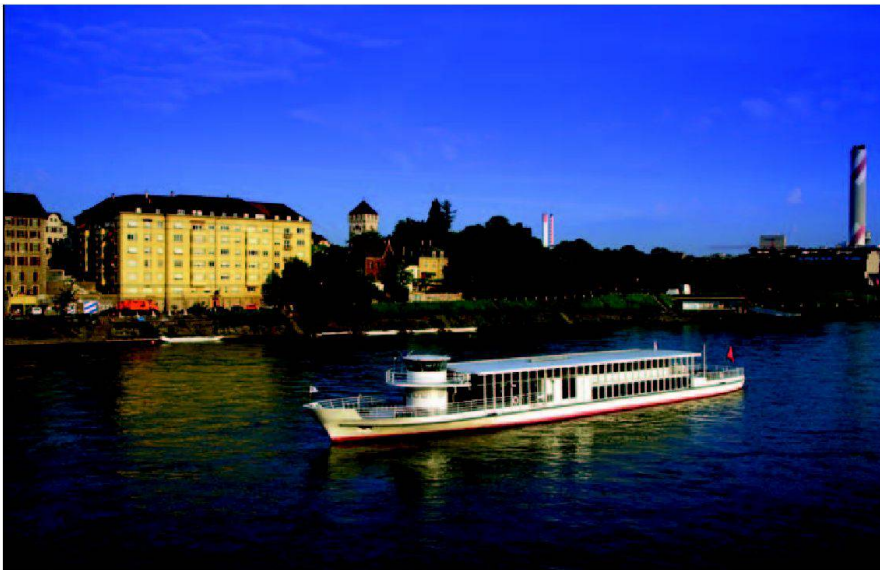
MS Christoph Merian.