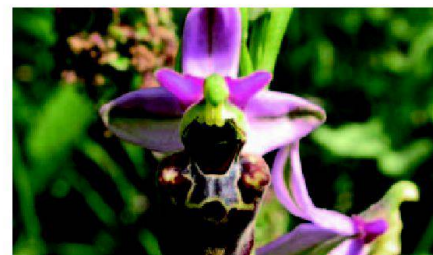
Fig. 7: Les orchidées, trésor de Soulce, avec 23 espèces et des milliers de pieds.