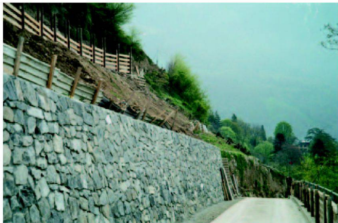
Fig. 3: Chemin de base avec consolidation des sols.