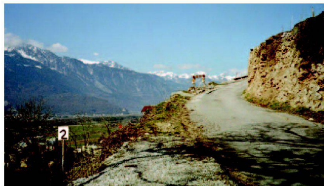
Fig. 2: Chemin no 1, accès vers les Hauts du syndicat.

Le projet d'exécution a été établi sur la base d'un relevé photogrammétrique au 1:500 et selon les lignes directrices de