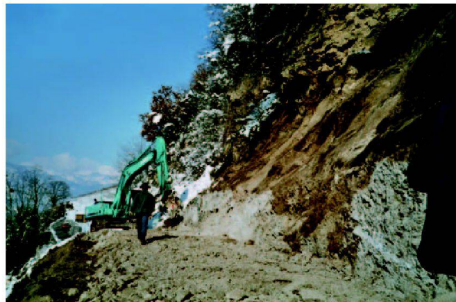
Fig. 4: Accès intermédiaire et purge des falaises.

l'avant-projet des travaux collectifs établi au 1:2000. De nombreuses difficultés sont vite apparues.