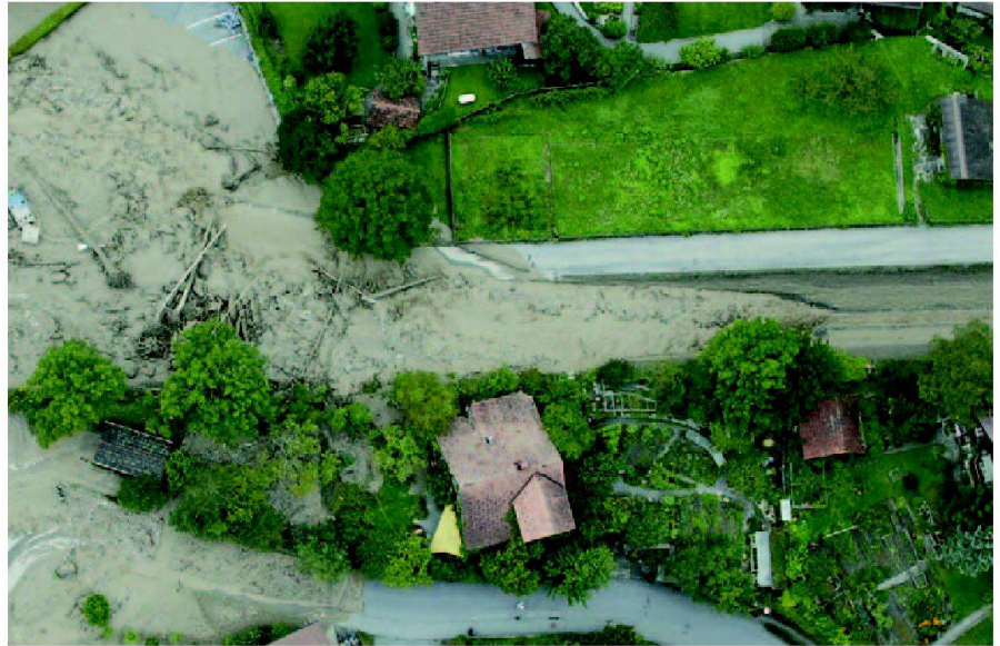
Abb. 1: Bilder hoher Auflösung erlauben die genaue Rekonstruktion der beteiligten Prozesse.

Wie die allgemein bekannt gewordenen Bilder aus Brienz zeigen, sind in den Berg-