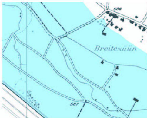
Abb. 5: Gebiet des Aaredammbrochs bei Meiringen im Originalbild (links) und im entsprechenden Ausschnitt Prozessraumkarte (rechts, hier nur Prozess «Wasser» dargestellt).