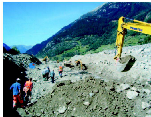
Abb. 4: Um in den Ablagerungsbergen die Übersicht zu behalten, müssen gute geometrische Grundlagen zur Verfügung stehen.

Ein wichtiges Resultat bildet die Prozessraumkarte , die vom Oberingenieur Kreis I in Auftrag gegeben wurde. Ziel dieser Karten war eine flächige Darstellung der Prozessräume, aufgeteilt nach den Prozessarten Wasser, Murgang und Erosion (vereinfacht). Detailinformationen zu den einzelnen Prozessen wurden nicht nachgefragt. Mit Hilfe von Luftbildern vom 23. August 2005 konnten die betroffenen Flächen einfach und eindeutig identifiziert und erfasst werden, da die maximalen Wasserstände noch sehr deutlich sichtbar waren.