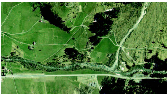
Abb. 2: Der Aarelauf und die Strasse oberhalb Guttannen vor dem Ereignis.

halten und das Dorf wurde am 22. August von der Aare überschwemmt. Als Sofortmassnahme musste für die Aare ein neues Bett gegraben und eine Notstrasse zur Sicherstellung des Zugangs zu den Kraftwerkenanlagen der KWO gebaut werden (Abb. 4). Nach der Befliegung vom 23. August wurden die Luftbilder noch in derselben Nacht orientiert und ausgewertet. Damit standen zur Planung und Ausführung dieser riesigen Erdarbeiten bereits am 24. August die photogrammetrischen Daten der neuen Topographie und die Mächtigkeit der Schuttablagerung bereit. Ähnliche Beispiele wären aus Brienz, dem Diemtig- und dem Lüttschental zu zeigen.