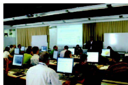
Fig. 2–4: Des ateliers bien visités.