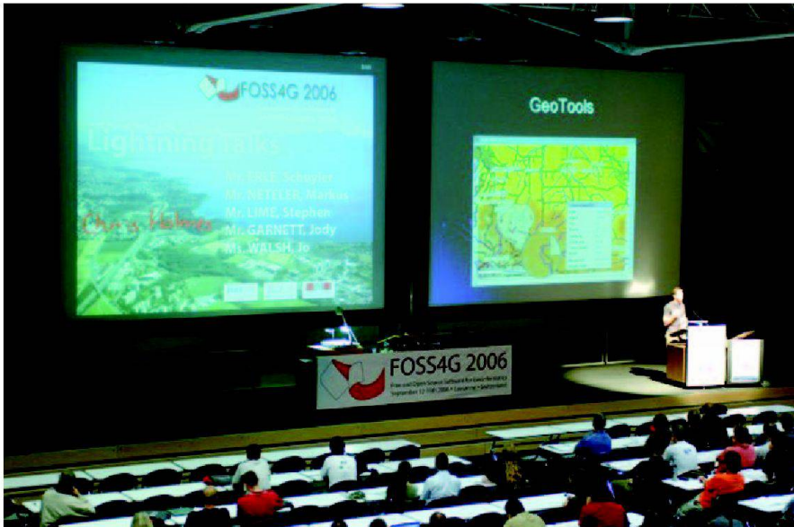
Fig. 5: Séance en plénum.

Les communautés suivantes étaient représentées: