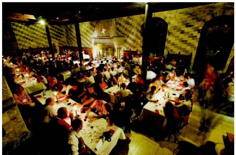
Fig. 6: Repas au Château de Chillon.