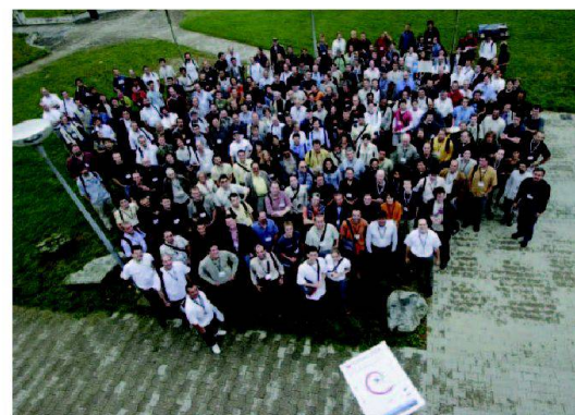
Fig. 1: Une partie des participants FOSS4G 2006.

Le matin du mercredi 13 septembre était réservé à la session d'ouverture en plénum. Il a été rappelé que le premier mee-