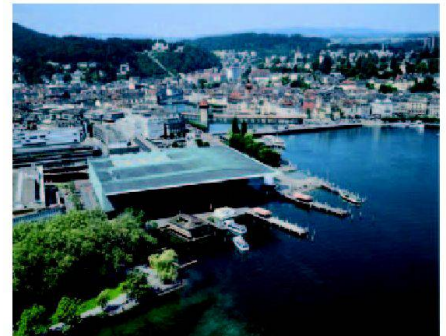
Luzern mit KKL.