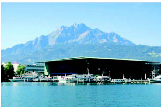
Luzern: Pilatus und KKL.