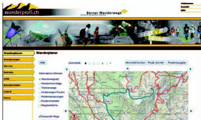
Tourenplanung im Wanderprofi.