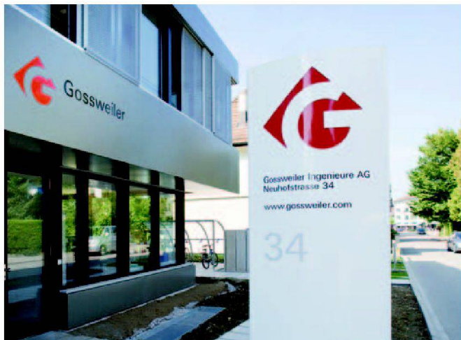
Neues Bürogebäude der Gossweiler Ingenieure AG.

Die Gossweiler Ingenieure AG ist ein vielseitiges Ingenieurunternehmen im Grossraum Zürich und beschäftigt rund 70 Mitarbeiter. In den Bereichen Raum und Verkehr, Recht und Bau, Tiefbau, Wasser, Umwelt und Kulturtechnik, Vermessung, Geoinformatik sowie Gemeindeingenieurwesen bietet die Gossweiler Ingenieure AG den Kunden Ingenieur- und Beratungsleistungen von hoher Qualität. Dank langjähriger Erfahrung, ihrem breiten Tätigkeitsfeld und konstanter Investitionsbereitschaft in neue Technologien erarbeitet die Gossweiler Ingenieure AG gesamtheitliche und innovative Lösungen.