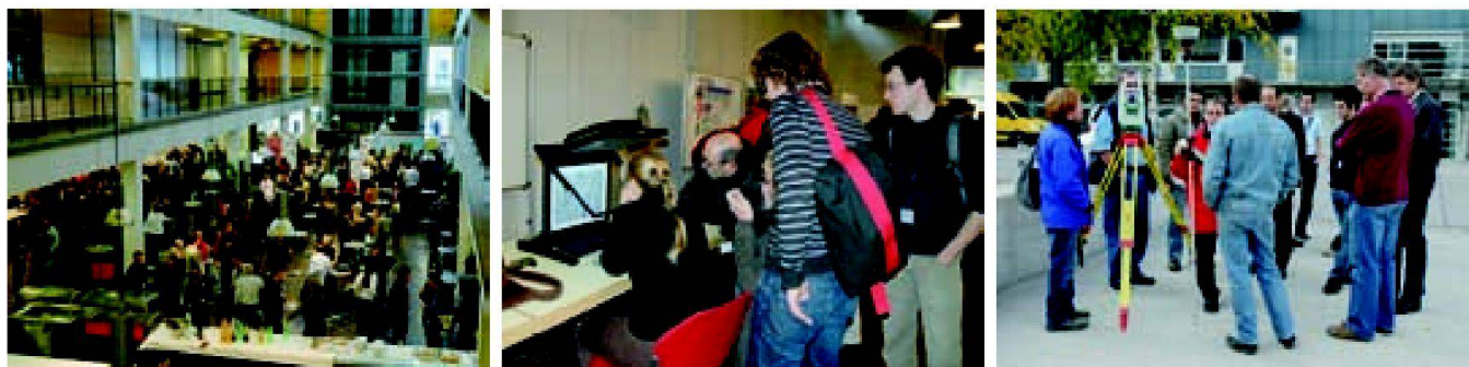
Ausstellung am Nachmittag zusammen mit zehn Partnerfirmen.