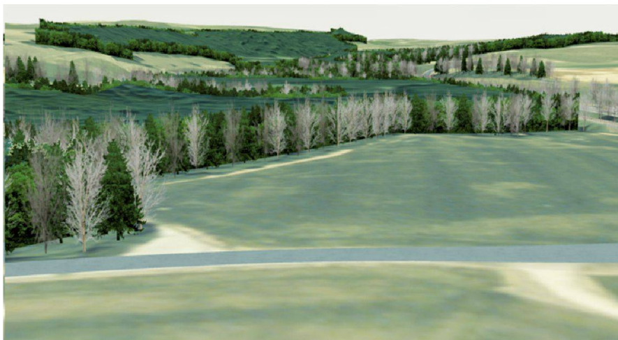
Fig. 3: Détail des lisières de forêts de synthèse.

MNT25 (modèle numérique du terrain à 25 m) de Swisstopo «habillée» avec la prise de vue aérienne correspondante orthonormée. Une vue de vol d'oiseau de la maquette est représentée dans la figure 2 et on voit sur la partie gauche de l'image la structure de la maquette composée de triangles. Dans cette vue, il y a environ 45 000 triangles texturés qui doivent être calculés 20 fois par seconde ou plus. Un PC portable avec un processeur graphique de la dernière génération y arrive sans problèmes.