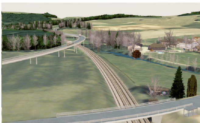
Fig. 4a: Passage des voies CFF (variante 1).

Etienne Pétremand Ingénieur informaticien de IICT-Cap3D HEIG-VD, rte de Cheseaux 1 CH-1400 Yverdon-les-Bains alexander.knob@heig-vd.ch etienne.petremand@heig-vd.ch