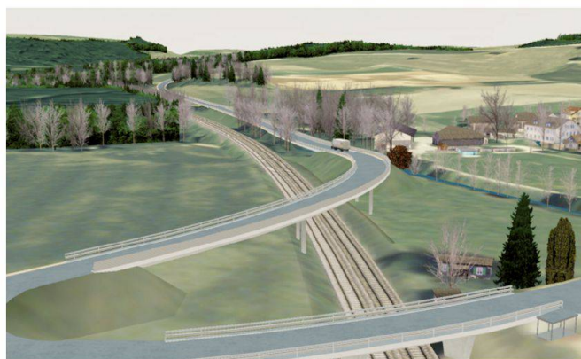
Fig. 4b: Passage des voies CFF (variante 2).