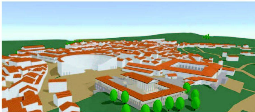
Abb. 2: Virtuelle Römerstadt Augusta Raurica (Diplomarbeit 2006, Wüthrich und Brosi).

tive 3D-Geoinformation wurden im Jahr 2006 konsequent weitergeführt und erweitert in Richtung Geo Sensor Web, mobile Sensorplattformen und kollaborative 3D-Technologien.