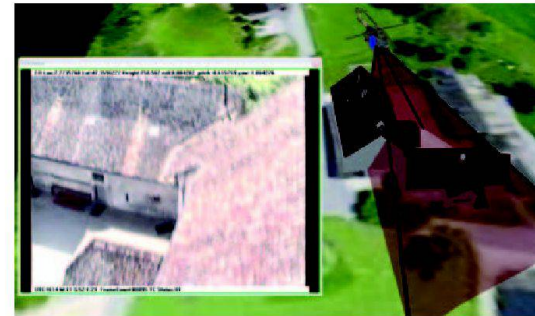
Abb. 4: ViMo (Virtual Monitoring) – Testflug mit 3D-Modell Kloster Schönthal.

Unsere Partnerschaft mit der FH Dresden (HTW) besteht nunmehr seit vierzehn Jahren. Zwei Studierende aus Dresden nahmen in diesem Jahr für zwei Wochen am Unterricht des sechsten Studiensemesters teil (Deformationsmessungen Sperre und Ägerdi, Gemeinde Schwanden b. Brienz). Vier Studierende des