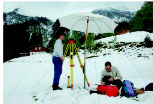
Abb. 1: Schnee im Mai – Blockkurs G6, Brienz.

Zum Beginn des Wintersemesters 2006/07 nahm die zweite Bachelor-Klasse ihr Studium auf. Erste Erfahrungen mit dem Ende 2006 im 3. Semester studierenden ersten Bologna-Jahr-