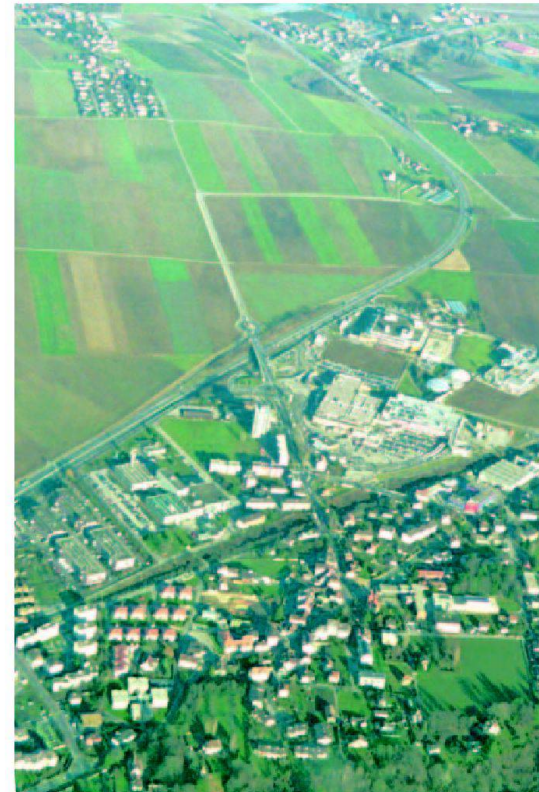
Abb. 1: Zersiedelte und strukturell verarmte Landschaft im schweizerischen Mittelland.

dert hätte. Schon 1955 hatte ein schmales rotes Büchlein mit dem Titel «achtung: die Schweiz» vor einer unkontrolliert wachsenden Stadtlandschaft gewarnt. Die drei Autoren Lucius Burckhard, Max Frisch und Markus Kutter schlugen vor, die Begrenztheit der Fläche als gegebene Herausforderung zu respektieren, die