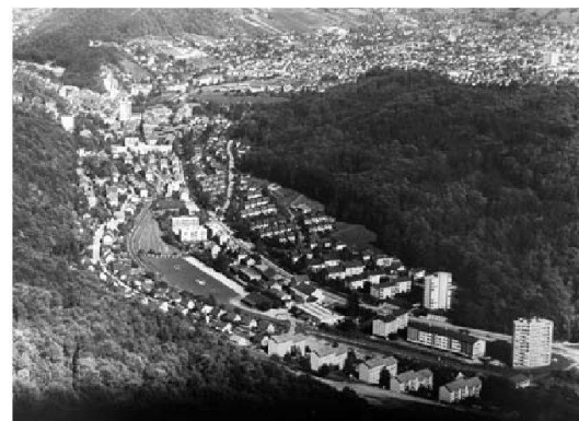
Abb. 1: Flugaufnahme Quartier Meierhof, Baden, 1962, Hans Suter.

beit, Raumplanung, Ökologie, Architektur, Bildung und ein enges Zusammenspiel zwischen Verwaltung, Politik und der betroffenen Bevölkerung. Der Einbezug der Bevölkerung und deren Mitarbeit erhöhen die Erfolgchancen bei Veränderungsprozessen. Gefragt sind neue Gestaltungsräume und Gestaltungsmöglichkeiten, neue Formen der Partizipation und ein professionelles Management von Prozessen in der Gemeinde-, Stadt- und Regionalentwicklung. Im MAS-Programm Gemeinde-, Stadt- und Regionalentwicklung (GSR) werden Kenntnisse und Konzepte vermittelt, Erfahrungen ausgetauscht, Problemstellungen vertieft und die Studierenden dazu befähigt, kompetent in Prozesse und Entwicklungen in Gemeinden, Städten und Regionen einzugreifen.