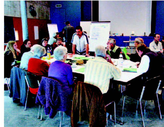
Abb. 5: Workshop im Quartierentwicklungsprozess.

Informationen unter www.hsa.fhz.ch/masgsr oder Ute Andree, Telefon 041 367 48 64, uandree@hsg.fhz.ch