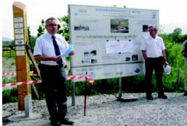
Abb. 4: Präsentation der sehr naturnah gestalteten Aufweitung des Rheintaler Binnenkanales als Teil des Projektes Hochwasserschutz Rüthi im St. Galler Rheintal.