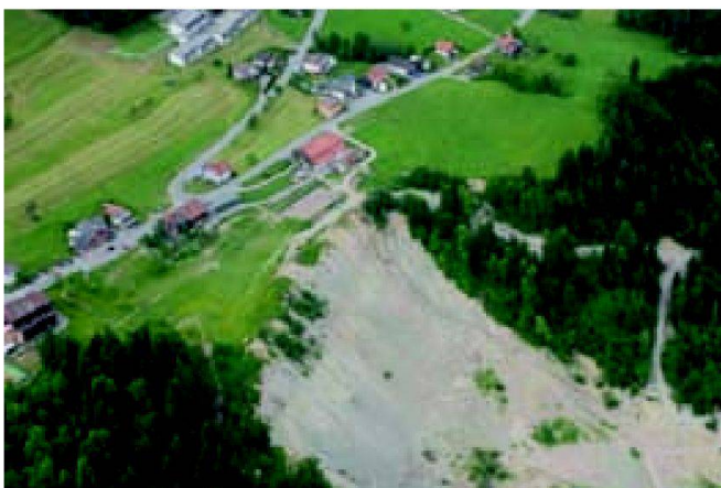
Abb. 1: Hangrutschung Doren in Vorarlberg.

Leider war auch von den Fachleuten immer wieder das Wort «Naturkatastrophe» zu hö-