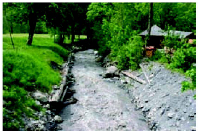
Abb. 2: Je nach Witterung nicht ganz harmloser Zubringer im Weisstannental (St. Gallen).