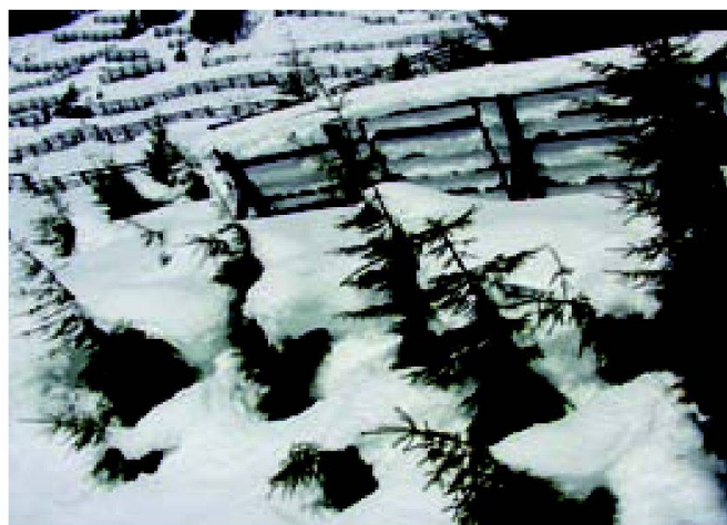
Abb. 6: Lawinenverbauungen.