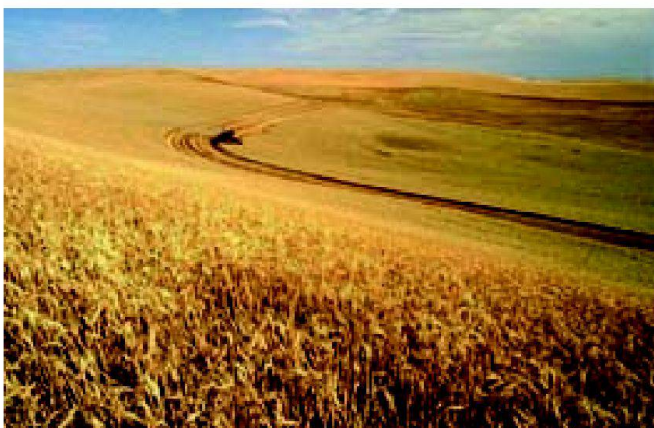
Abb. 3: Agrarlandschaft USA.

Unsere Ressourcen für eine globale Ernährungssicherung sind limitiert. Insgesamt verfügen wir noch über Fünfmilliarden Hektar landwirtschaftlicher Nutzfläche, die allerdings von sehr unterschied-