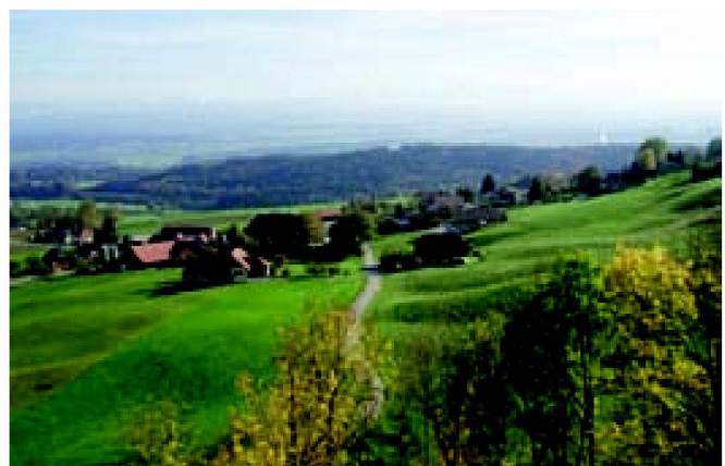
Abb. 4: Agrarlandschaft Schweizer Mittelland.