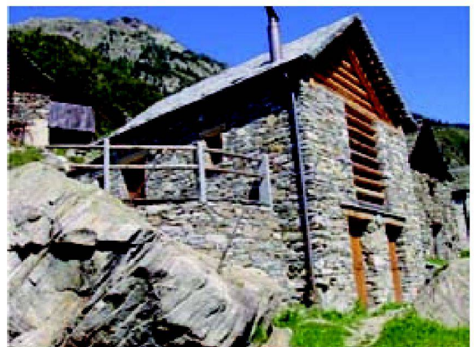
Abb. 2: Agrotourismus.