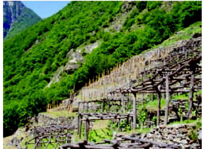
Abb. 4: Pergolareben alt und neu.

sie müssen für den Ressourcenschutz und den interkommunalen Ansatz sensibilisiert werden.