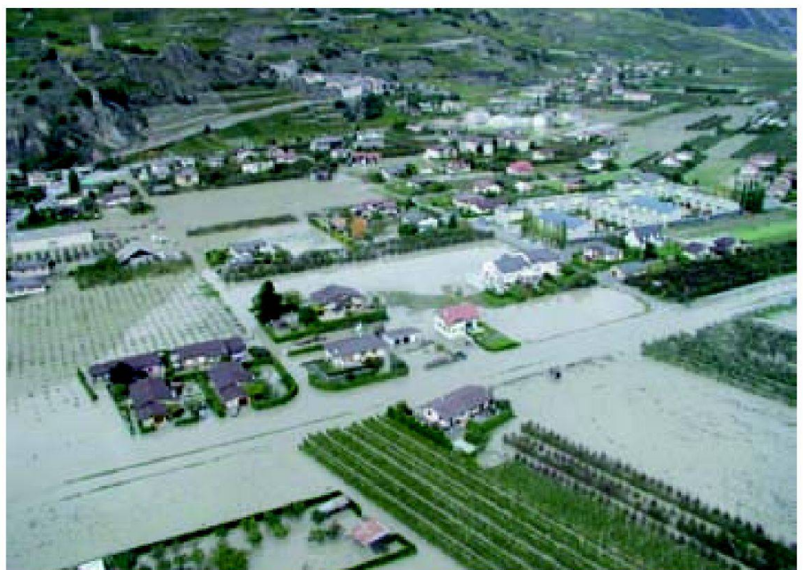
Fig. 1: Saillon (VS) 2000.