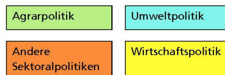
Abb. 2: Zuordnung der politischen Massnahmen in der Schweiz zur zweiten Säule der GAP.