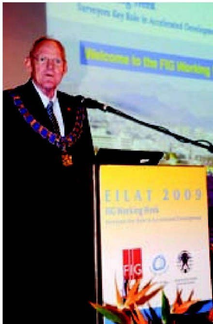
Abb. 3: FIG-Präsident Stig Enemark.

Kommissions-basierten Sessionen präsentiert und diskutiert.