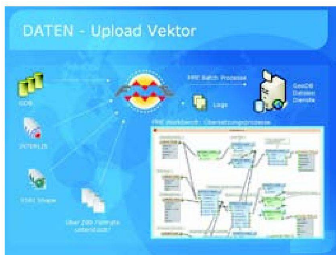
Abb. 1: Datenfluss und Inputprozesse bei GeoGR.

Getreu modernen Grundsätzen des Qualitätsmanagements, wonach Qualität hergestellt