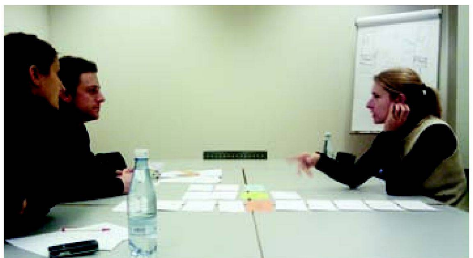
Abb. 1: Arbeit im Team.

Ein geeignetes Instrument, das sich anbietet, ist die Intervision. Intervision – auch «kollegiale Beratung» genannt – ist eine Möglichkeit, um berufliche Aspekte zu reflektieren. Intervision findet innerhalb einer Gruppe von Menschen statt, die in einem ähnlichen Berufsfeld arbeiten und wird sowohl im Wirtschafts- als auch im Sozialbereich angewandt. Neu an unserem Beispiel ist, dass wir diese Methode auf den interdisziplinären Kontext der Gemeinde-, Stadt- und Regionalentwicklung übertragen haben – und dass diese Methode in Planungsberufen noch wenig Eingang gefunden hat. Im Rahmen des Studiengangs «Master of advanced Studies in Community Development» an der Hochschule Luzern (siehe Kasten) haben wir Problemstellungen aus unserem beruflichen GSR-Alltag im Rahmen von Intervisionssitzungen bearbeiten können. In