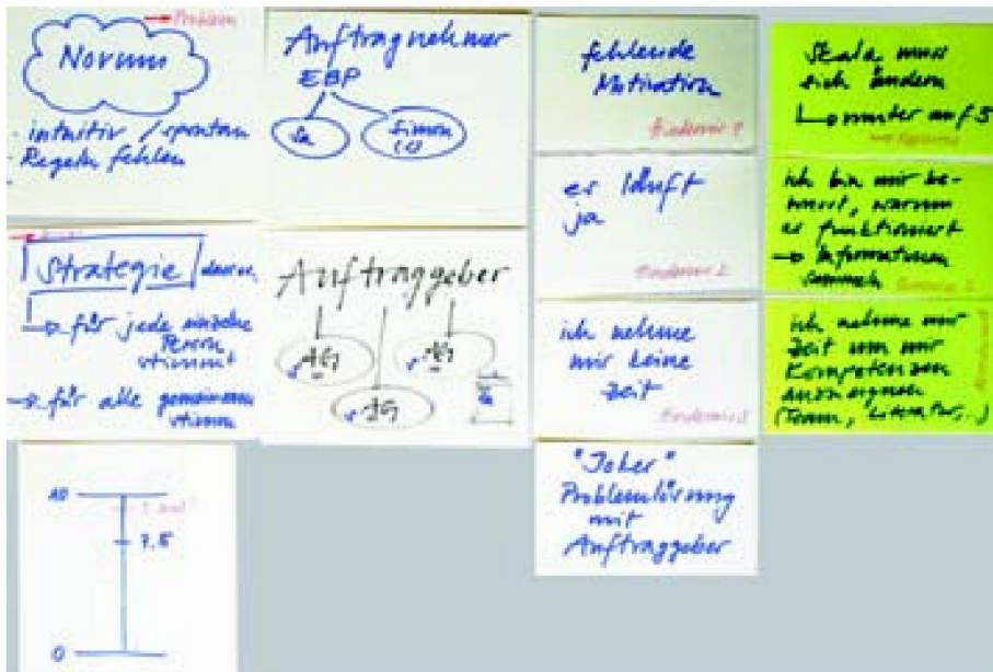
Abb. 2: Auslegeordnung.

mehreren Meetings haben wir uns Zeit genommen, unterschiedliche Methoden auszuprobieren. Dafür sprach der Ansatz der individuellen, auf die einzelne Problemstellung zugeschnittene Beratung. Unsere Ziele waren es, einen möglichst grossen Wissenszuwachs zu generieren, ein breites Spektrum an Beratungsformaten kennen zu lernen und zu erproben und passende Resultate zu erhalten. Fazit: Mit wenig Aufwand hat viel rausgeschaut.