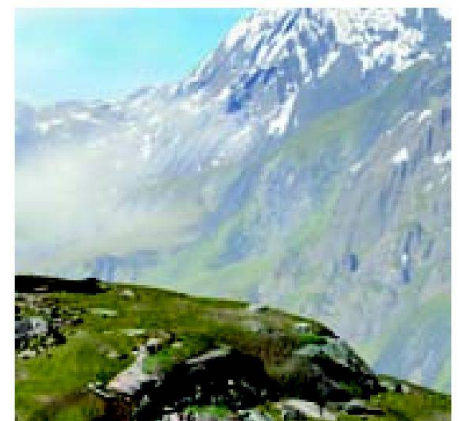
Abb. 2: Virtuelle Landschaft.

An der Weltausstellung im Jahre 1900 in Paris wurde Imfelds Relief der Jungfraugruppe ausgestellt (Abb. 1). Es warb für die damals im Bau befindliche Jungfrau-bahn. Das Relief diente als Botschafter für den schweizerischen Alpentourismus. Aber auch heute kann ein Relief das weltweite Publikum für die Alpenregion begeistern. 2005 wurde an der Weltausstellung in Aichi in Japan mit dem Projekt «Der Berg» eine moderne Art eines Reliefs gezeigt. «Der Berg» war ein begehrtes Relief, bestehend aus einer bedruckten Membran aus Kunststoff, die zugleich die Hülle für den darunterliegenden Ausstellungsraum war. «Der Berg» zeigte keine originalgetreue Abbildung eines Ortes, sondern wollte vielmehr die Impressionen einer Berglandschaft erwecken. «Der Berg» war die konkrete Realisierung einer virtuellen Landschaft (Abb. 2).