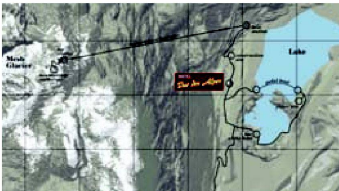
Abb. 3: Landkarte einer virtuellen Landschaft.

Mehr Erfolg hatte das Bourbaki-Panorama aus dem Jahr 1881 (Abb. 6). Das Bourbaki-Panorama zeigt die französische Ostarmee beim Übertritt in die Internierung in der Schweiz. Eine Darstellung, welche das Publikum faszinierte. Das Thema des