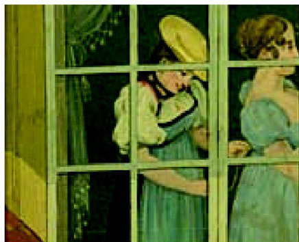
Abb. 7: Detail aus dem Woche-Panorama.

Tief in die Realität eintauchen lassen einen auch die aneinander gereihten Pa-