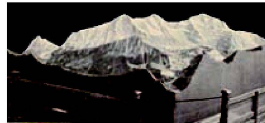
Abb. 1: Modell der Jungfraugruppe 1900 in Paris.

Questo contributo è stato allestito per la manifestazione, organizzata per il centenario dalla morte di Xaver Imfeld, intitolata «Geomatica con tradizione e futuro» presso il Politecnico di Zurigo. L'articolo è incentrato sull'attualità degli edifici con rilievi e i panorami alpini e si riallaccia all'esposizione. Ai tempi di Xaver Imfeld (1853–1909) il rilievo rappresentava una delle poche possibilità di osservare le montagne dall'alto. I panorami mostravano la vista che si vedeva dalle vette di una montagna. L'osservatore del rilievo spaziava sul paesaggio, osservando i panorami li viveva dall'interno. Oggi è più facile godersi la vista da una montagna poiché la maggior parte delle vette sono raggiungibili in teleferica. L'alpinismo ha perso il carattere di una spedizione legata a certi rischi ed è diventato uno sport di massa. Oggi è anche possibile ammirare il paesaggio dall'alto. In mongolfiera, voli in elicottero o aereo, deltaplano e parapendio sussistono innumerevoli possibilità? a di volteggiare sopra il paesaggio. Ma