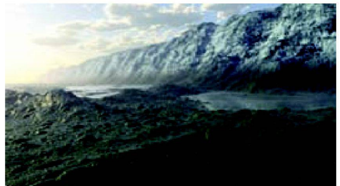
Abb. 4: Virtuelle Ansicht des Meeresbodens ohne Wasser.