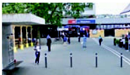
Abb. 8: Detailansicht aus Street View.

Betrachtet man die zahlreichen Varianten, mit denen heute versucht wird, ein Gelände, eine Landschaft oder einen Ausschnitt derselben abzubilden, so stellt man fest, dass das Interesse an solchen Darstellungen seit der Zeit von Xaver Imfeld sicher nicht abgenommen hat. Selbst physische Reliefs werden heute, wie das Projekt «Der Berg» zeigt, noch gebaut. Allerdings werden die meisten modernen Reliefdarstellungen virtuell erzeugt. Das prominenteste Beispiel ist zurzeit wohl