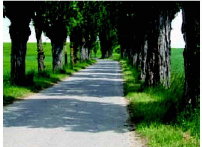
Fig. 4: Allée de peupliers à Avusy (GE).