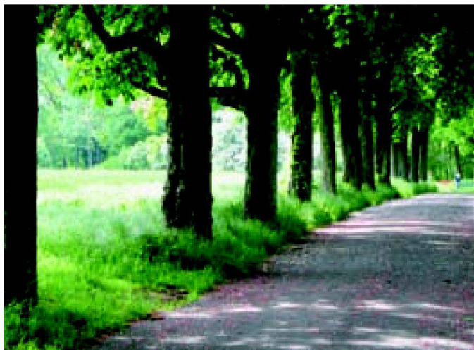
Fig. 1: Les allées sont un but de promenade prisé (Engadine, Berne).

Consciente du danger qui menace ce patrimoine paysager et historique, la Fondation suisse pour la protection et l'aménagement du paysage (FP) a réalisé et publié en 2008 une étude intitulée «Etat des lieux et importance des allées et paysages d'allées en Suisse». Celle-ci résume l'histoire des allées en Europe et en Suisse, décrit leurs différentes fonctions et en propose une typologie, introduit le concept