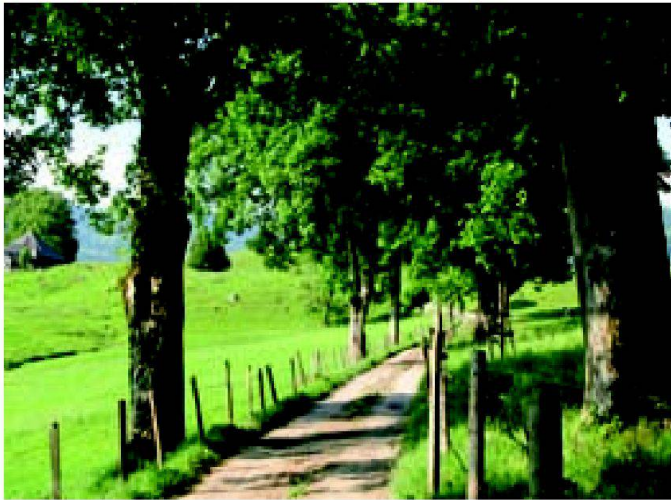
Fig. 3: Allée à La Monse (FR).