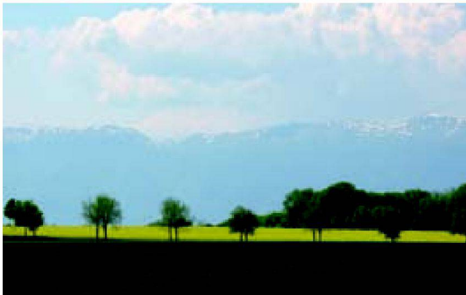
Fig. 5: Paysage avec allée (Jussy GE).