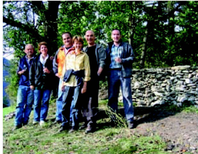
Abb. 5 und 6: Das Engagement der Kursteilnehmer zeigt Resultate. Wer ist da nicht stolz auf Vollbrachtes!

fentliche Hand direkt oder indirekt ein, zwar über lokale Initiative und Mitwirkung wie auch einige private Mitwirkende, deren Engagement nicht zu unterschätzen ist. Dabei kamen im Rahmen der Submissionsordnung auch lokale und überregionale Baufirmen und Spezialanbieter zu Aufträgen.