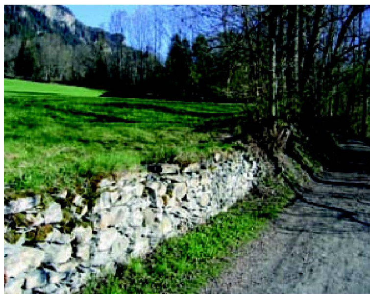
Abb. 3: Die klassische primäre Mehrfachfunktion der Trockenmauer: Stützen, Terrassenbildung, Abgrenzung, Linearelement entlang Weganlage (Gemeinde Almens).