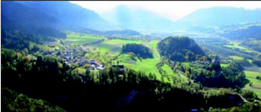
Abb. 1: Blick ins Domleschg von Nord nach Süd, links die Geländeterrassen mit den Dörfern Vorn Tomils, rechts die Hinterrheinebene und im Hintergrund der Einschnitt der Viamalaspaschluoch.

mauer ein notwendiges funktionales Instrument, das durch diese Gesellschaftsgruppe erstellt und unterhalten wurde. In der heutigen Gesellschaft und Landschaft ist die Trockenmauer nur noch marginal für die agrarische Nutzung notwendig (aus Sicht der Bewirtschaftung auch Hindernis). Hingegen sind die sekundären Trockenmauer-Funktionen massgebend, ob sich eine Landschaft als Erholungsraum oder touristischer Raum eignet. Dieser Paradigmenwechsel fordert eine neue Rollenverteilung insbesondere für den Unterhalt, in dem die Anbieter für die «neuen Nutzniesser» (Erholungssuchen-