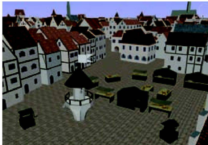
Abb. 1 und 2: Duisburg1566.