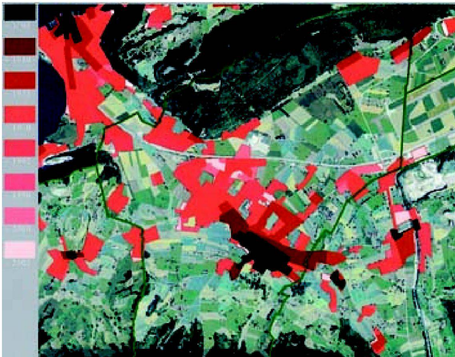
Abb. 1: In der Arealstatistik von Stans ist das überproportionale Siedlungswachstum der letzten Jahrzehnte, welches sich vorwiegend in der Schwemmebene etablierte, eindrücklich zu erkennen.