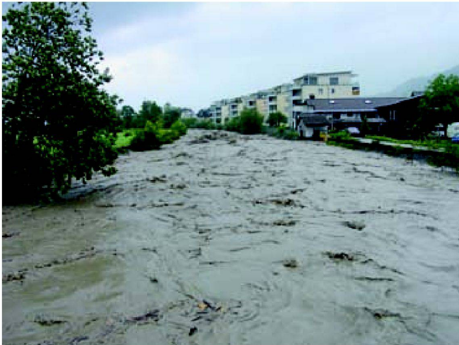
Abb. 5: Die Abflussmenge von 230 \text{ m}^3/\text{s} wurde selbsttätig auf die vorhandene Abflusskapazität von 150 \text{ m}^3/\text{s} in Buochs entlastet. Ohne Entlastungen wäre ein Dambruch in Buochs nicht abzuwenden gewesen.