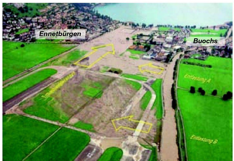
Abb. 4: Die Engelberger Aa beim Abklingen des Hochwassers 2005. Das «Zuviel» an Wasser verlässt das Flussbett an den vorgesehenen Stellen und strömt durch den Entlastungskorridor zwischen Ennetbürgen und Buochs dem Vierwaldstättersee zu. Im Flussbett verbleiben maximal 150 m³/s.

Die Planung und Projektierung des Hochwasserschutzprojektes Engelberger Aa begann 1987 und erfolgt in sechs Etappen. Die ersten vier Etappen in der stärker besiedelten unteren Talebene wurden Ende 2007 fertiggestellt. Die Hauptelemente des Projektes sind Hochwasserentlastungen für den Überlastfall, Gerinneverbreiterungen, Dammverstärkungen, Uferschutzsanierungen, naturnahere Gestaltung, Anpassen von Brücken, Schutzmassnahmen im Überflutungsgebiet sowie die Verbesserung des Geschiebehaushaltes. Mit diesen Massnahmen wurde zugleich eine landschaftliche und ökologische Aufwertung des Flussraumes realisiert. Damit kann die Forderung des Bundesgesetzes über den Wasserbau «nach Wiederherstellung eines natürlichen Flusslaufes» weitgehend erfüllt werden. Die Naherholung wurde als