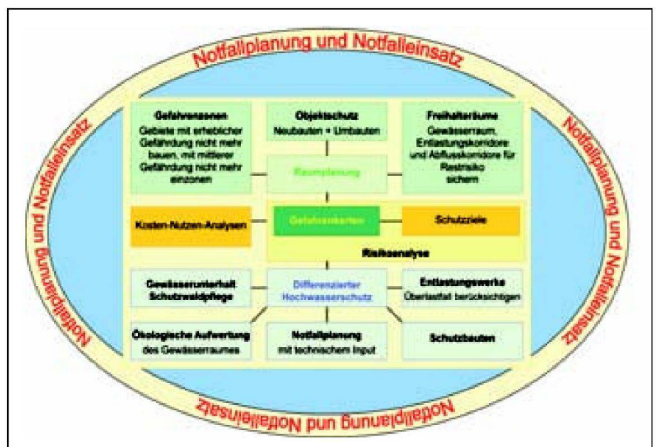
Abb. 2: Integrales Risikomanagement in der Hochwasserprävention.

Der für den Überlastfall vorgesehene Entlastungskorridor ist im kantonalen Richtplan und in den kommunalen Nutzungsplanungen festgelegt und mit weitergehenden Bestimmungen gesichert. Damit die Gewässer ihre Funktionen für den