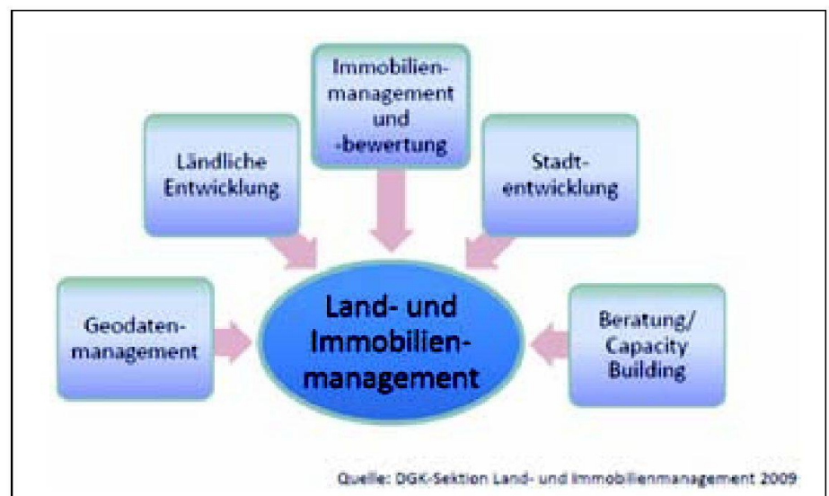
Abb. 1: Land- und Immobilienmanagement.