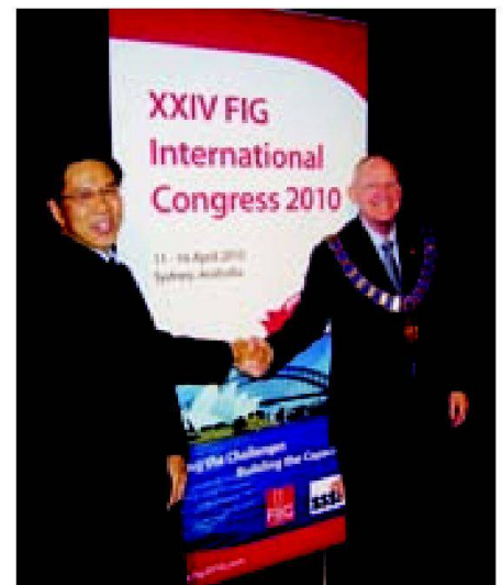
Abtretender FIG-Präsident Stig Enemark (rechts) und neuer Präsident Teo Chee Hai.

Die Hauptthemen der Generalversammlung, welche am Sonntag 11. und am Freitag 16. April stattfanden, waren die Wahl des Nachfolgers von FIG-Präsident Stig Enemark für die Periode von 2011 bis 2014 einerseits und des Ortes für den nächsten Kongress 2014 andererseits. Aus den drei zur Verfügung stehenden Kandidaten wurde schliesslich der aus