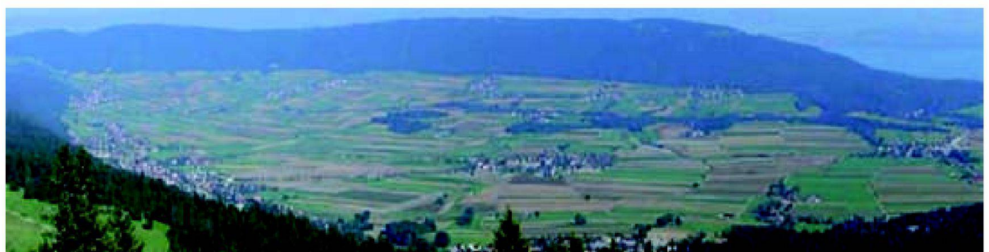
Abb. 3: Das Val-de-Ruz, vom Jura aus gesehen in Richtung Neuenburgersee (im Hintergrund).

Schon bei der Erarbeitung des REP wurde klar, dass die Landwirtschaft sehr stark mit der Wasserwirtschaft des Val-de-Ruz verknüpft ist, und dass keine ganzheitliche Lösung ohne den Einbezug der Landwirte möglich war.