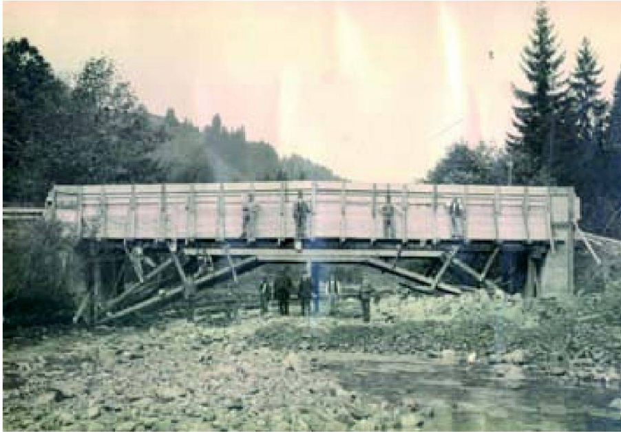
Abb. 3: Bau der Betonbrücke mit Lehrgerüst (1928).

eine gedeckte Holzbrücke aus dem Jahr 1880. Die Bauherrschaft wünschte, entsprechend der Tradition im Oberen Emmental, eine neue gedeckte Holzbrücke zu realisieren. Die kantonale Denkmalpflege stimmte der Variante Holzbrücke zu, weil damit die bereits geschützte Häusergruppe Kemmeribodenbad ergänzt werden konnte. Das Amt wünschte, die Holzbrücke möglichst in den Proportionen aus dem Jahre 1880 zu erstellen. Obwohl günstigere Varianten für den Brückenbau möglich gewesen wären, waren die Subventionsbehörden (Bund, Kanton) bereit, unter Berücksichtigung denkmalpflegerischer und kulturhistorischer Aspekte auf den Bau einer neuen Holzbrücke einzutreten.