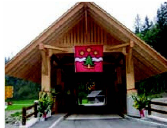
Abb. 5: Einweihung Kemmeribodenbrücke am 25. September 2009.

Ab Anfang August 2008 wurden die beiden neuen, bis 1.5 m unter die bestehende Emmesohle reichenden Betonwiderlager erstellt. Nach 2½ Monaten Bauzeit konnte ab Mitte Oktober 2008 mit