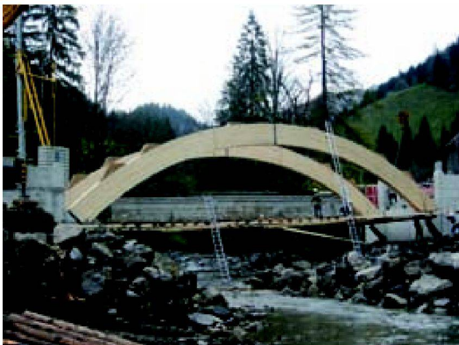
Abb. 6: Bauphase 1: Widerlager und Zweigelengkbogen.

der Montage der vorgefertigten Holzbrücke begonnen werden. Schon nach sechs Arbeitstagen war die Brücke fast fertig