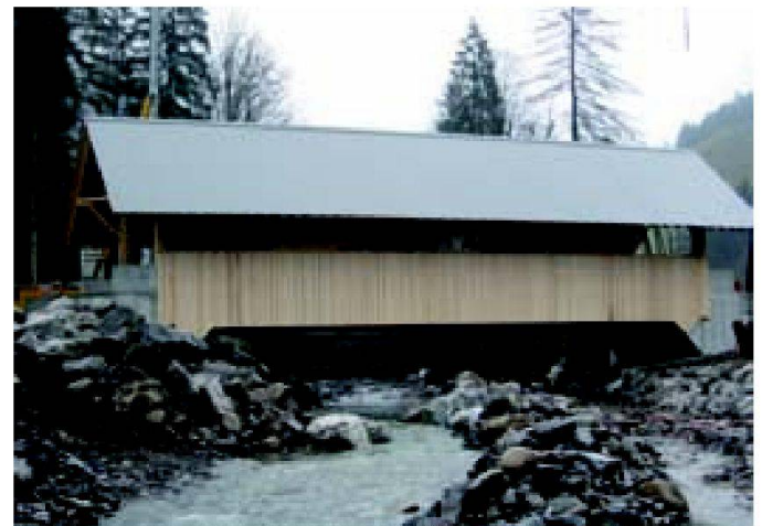
Abb. 9: Phase 4: Holzverkleidung als Wind- und Schneeschutz.