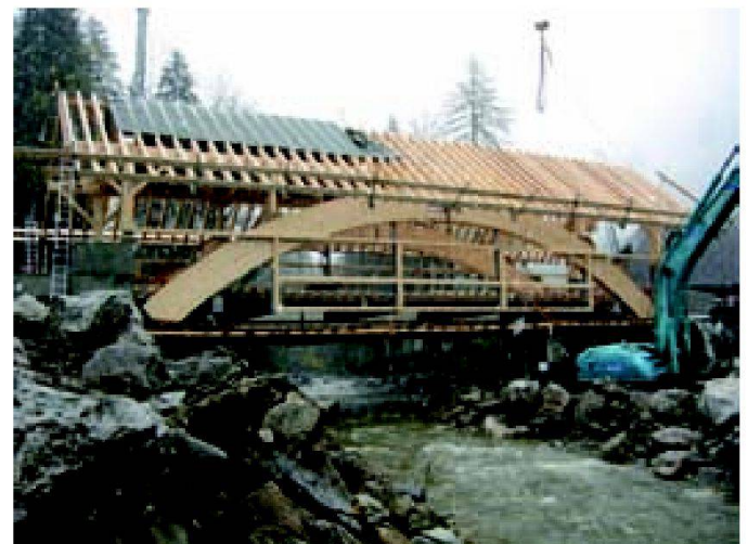
Abb. 7: Phase 2: Rohbau, Fahrbahnplatte mit Stahlhängepfosten an Gelenkbogen befestigt.