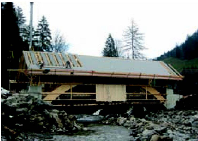
Abb. 8: Phase 3: Dachdeckerarbeiten.