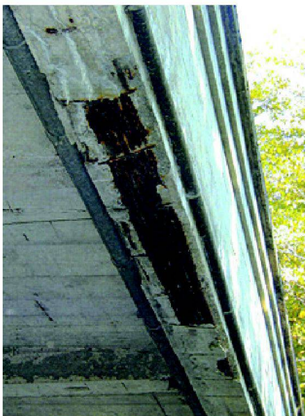
Abb. 4: Freigelegte Längsarmierung der Brückenuntersicht.

Nach dem Abwägen der Vor- und Nachteile einer Sanierung der bestehenden Betonbrücke mit Tragfähigkeitsverstärkung oder eines Neubaus kamen die beteiligten Stellen zum Schluss, dass ein Neubau angestrebt werden soll. Die Vorgängerin der heute bestehenden Betonbrücke war